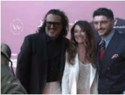
Chef Alessandro Borghese