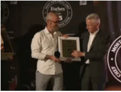
Chef Carlo Cracco e Chef Enrico Crippa