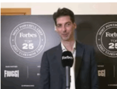
Chef Massimiliano Alajmo