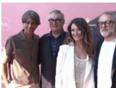
Chef Davide Oldani