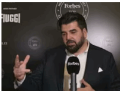
Chef Antonino Cannavacciuolo