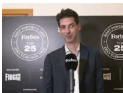
Chef Massimiliano Alajmo