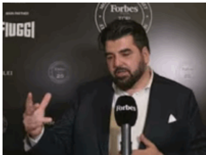
Chef Antonino Cannavacciuolo