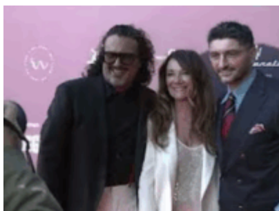
Chef Alessandro Borghese