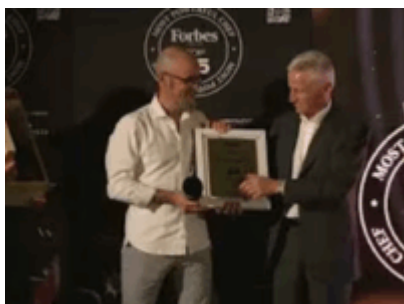
Chef Carlo Cracco e Chef Enrico Crippa