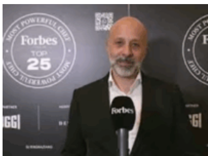
Chef Niko Romito